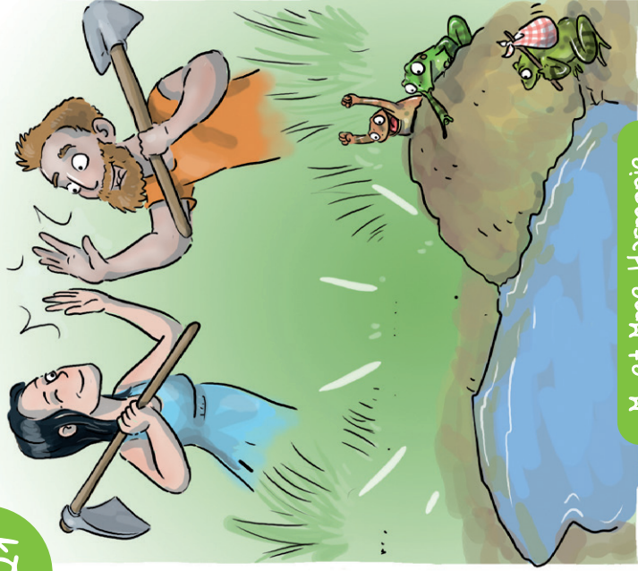
M. et Mme Harmonie

Amoureux de la nature, M. et Mme Harmonie décident de creuser une mare dans leur jardin afin d'offrir un havre de paix pour les amphibiens de leur territoire.