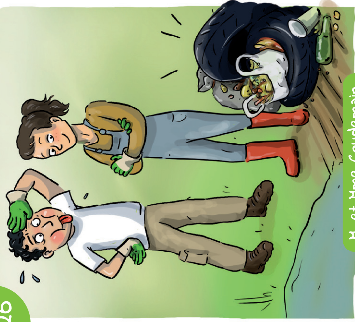
M. et Mme Coudemain

M. et Mme Coudemain se sont inscrits à un chantier participatif pour retirer des déchets de la mare communale. Grâce à leur action et à l'implication d'autres bénévoles, plus de 20 kg de déchets ont pu être retirés !