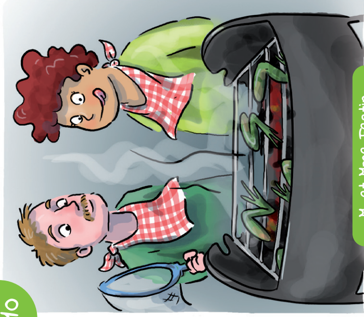
M. et Mme Festin

C'est l'été ! M. et Mme Festin convient leurs amis à un barbecue pour déguster les cuisses de grenouilles qu'ils ont pêchées dans leur mare !