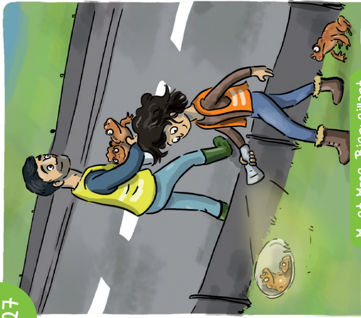
M. et Mme Bienveillant

Suite à la construction d'une route à côté de chez eux qui sépare deux points d'eau, M. et Mme Bienveillant mobilisent les habitants de leur commune afin de mettre en place un système pour aider les amphibiens à traverser sans danger, en période de migration !